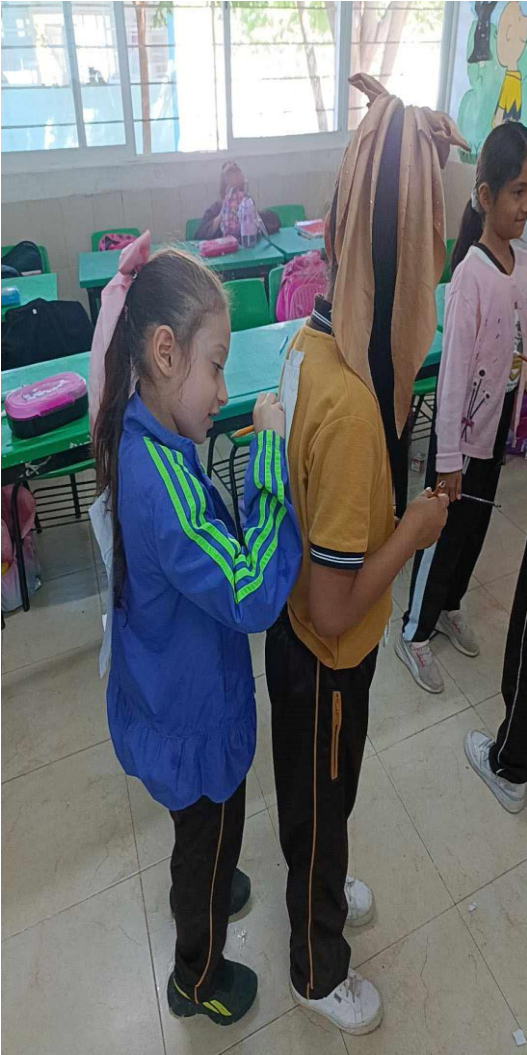
se puede apreciar la emoción en la cual los alumnos participaron en la actividad.