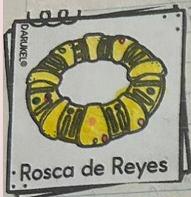
Rosca de Reyes

Con pan festejamos y convivimos Recorta y pega cada una imagen de los panes mexicanos