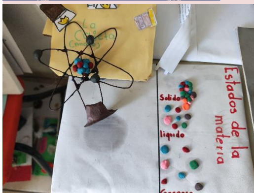
Fotografías de las 2 retroalimentaciones escritas realizadas desde su función docente: heteroevaluación.