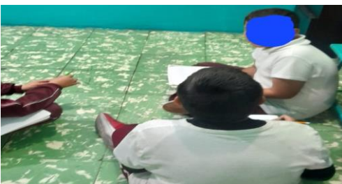
Exponiendo sus emociones