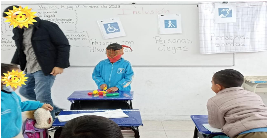
Trabajando la inclusión y empatía con las personas que sufren una discapacidad.