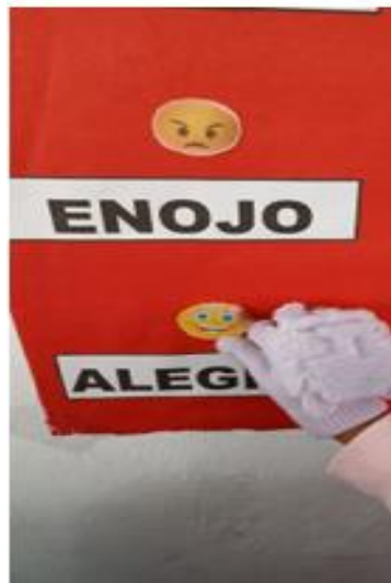
Identificando la emoción del día