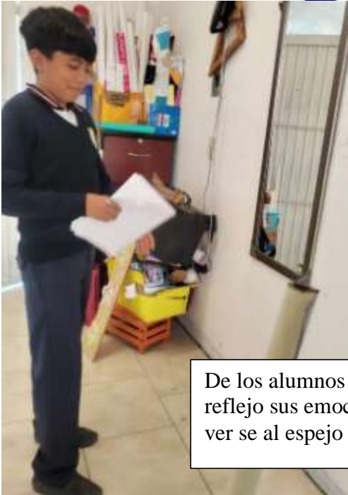
De los alumnos que más reflejo sus emociones al ver se al espejo