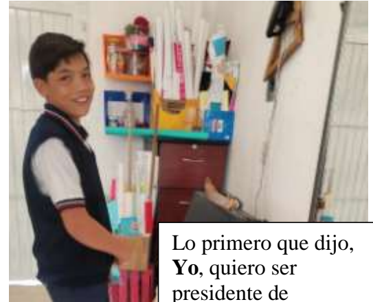
Lo primero que dijo, Yo, quiero ser presidente de Republica escolar